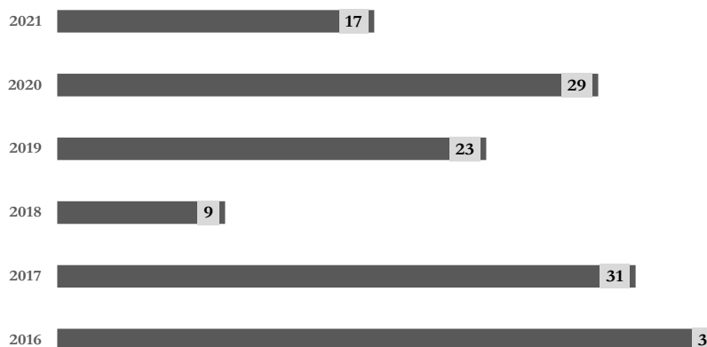
Ábra: A NAV által természetkárosítás miatt tett feljelentések száma

A természetkárosítás elleni hatékony fellépés céljából a NAV együttműködik számos társhatósággal. E téren meg kell említeni a 2021. április 1-jén létrejött Nemzeti Környezeti Biztonsági Munkacsoportot ( National Environmental Security Task Force ; NEST), amelynek célja a környezeti és természet elleni jogellenes cselekmények megelőzése. A munkacsoportban a NAV-on kívül részt vesz a rendőrség, az Agrárminisztérium, az Országos Rendőr-főkapitányság, valamint az Innovációs és Technológiai Minisztérium, az Országos Katasztrófavédelmi Főigazgatóság, továbbá a Pest Megyei Kormányhivatal és a Nemzeti Élelmiszerlánc-Biztonsági Hivatal. A NAV ezen kívül együttműködési megállapodást kötött szakmai szervezetekkel, így például a Magyar Állatkertek Szövetségével, valamint az Országos Állatvédőrség Alapítvánnyal.